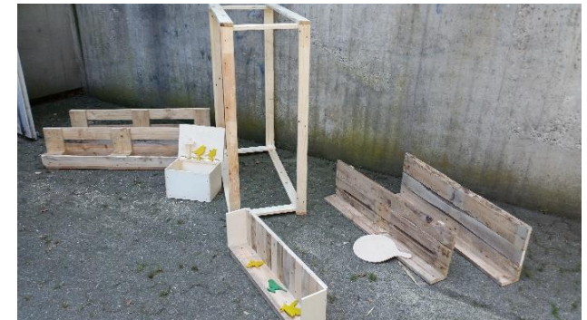
Arbeiten aus Kurs 2019/ Foto: privat